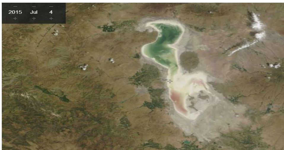
شکل ۱. روند پس‌روی و خشک‌شدن دریاچه ارومیه [۲۱]